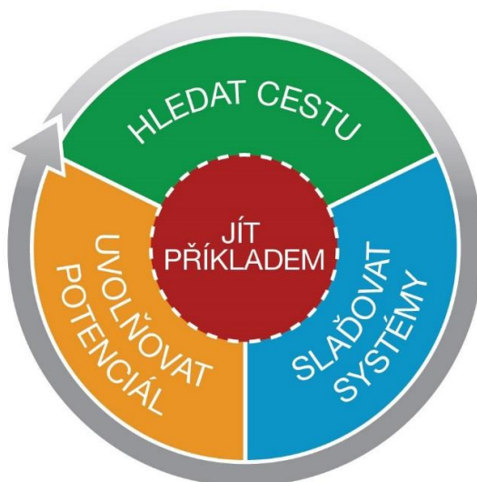
Obr. 3: Čtyři role výjimečných lídrů (FranklinCovey)

I nadále budu proaktivní, ale zároveň dostatečně empatický k potřebám pedagogického sboru, žáků i rodičů. Neustále budu pracovat na zkvalitňování našeho týmu (vhodné doplnění, vzdělávání, koučovací přístup a mentorské vedení). Na dobrovolné bázi zavedu triádu (chci motivovat a vysvětlovat přínos - podpora naší vize Společně k zodpovědnosti).