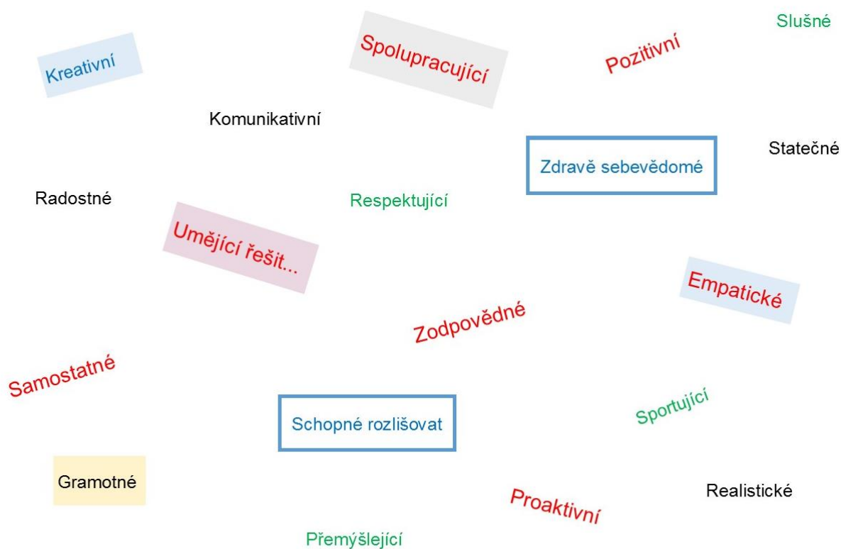
Obr. 2: Jaký žák by od nás měl odcházet (ukázka z harmonizačního pobytu ped. sboru ZŠ Skálova)

I já sám na sobě musím neustále pracovat, charakter a kompetentnost vedou k důvěryhodnosti a důvěře, bez které se žádný lídr ve školství neobejde. Na absolvovaný kurz Ředitel koučem v současné době navazují Akademií leadershipu pro vedoucí pracovníky a v budoucnu bych se rád zúčastnil programů jako je Systematické vedení týmu nebo 7 návyků skutečně efektivních lidí. Jako lídr chci co nejlépe zastávat tyto klíčové role: jít příkladem – vzbuzovat důvěru, která je klíčová pro všechno dění ve škole, hledat cestu – spolu s týmem najít cestu vedoucí ke splnění školní vize, která musí být jasná, přesvědčivá a věrohodná, sladovat systémy – zaměřit se na klíčové věci pro dosažení výsledků, uvolňovat potenciál – vytvářet prostor pro uvolnění talentu a nadšení lidí ve škole. A neustále se vracet k reflexi uskutečněných kroků a rozhodnutí.